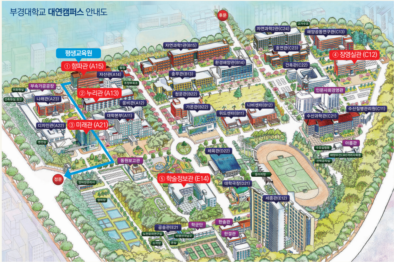
(48513) 부산광역시 남구 용소로 45 (대연동)

① 향파관 (A15) 3층 행정실, 3층~5층 강의실 ② 누리관 (A13) 음악실 및 무용실 ③ 미래관 (A21) 교육연수원 ④ 장영실관 (C12) 음악실 ⑤ 학술정보관 (E14) 컴퓨터실